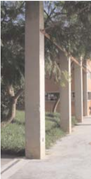
TERRAMAR celebra los 25 años de su puesta en marcha en septiembre de 1983. En aquel momento

fue el gran proyecto de APSA a partir de un núcleo de 60 usuarios/as del antiguo centro La Cantera. Su apertura, junto con la de Atención Temprana también a principios de los ochenta, provocó en la asociación un salto cualitativo respecto a todo lo que había sido su historia anterior.